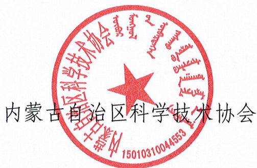
内蒙古自治区科学技术协会