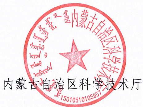
内蒙古自治区科学技术厅