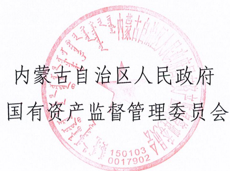
内蒙古自治区人民政府 国有资产监督管理委员会