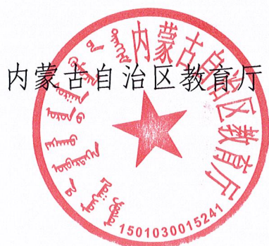
内蒙古自治区教育厅